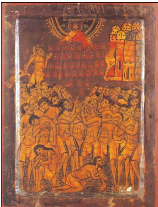
Εικόνα 5. Οι Άγιοι Σαράντα Μάρτυρες (9 Μαρτίου), προστάτες των εγκύων που είχαν συχνά αποβολές.

που παρατηρείται στις πρώτες ημέρες του Μαρτίου. Οι Άγιοι Σαράντα κατά τη δογματολογία των λαϊκών Μαιών ήσαν προστάτες για τις «Αραχνόγκαστρες» γυναίκες δηλ. τις γυναίκες που είχαν κατά σειρά τρεις συνεχείς αποβολές χωρίς εμφανή αιτία.