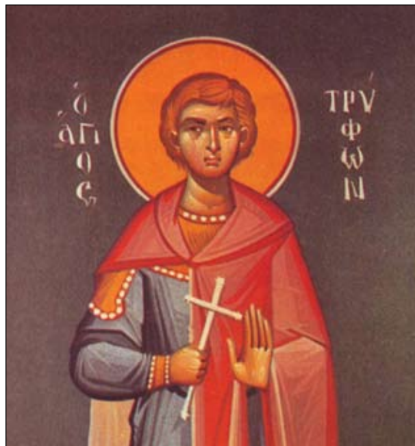
Εικόνα 3. Ο Άγιος Τρύφων ο Μεγαλομάρτυς.

Η πίστη του λαού ήταν ότι ο Άγιος αυτός ενίσχυε και προστάτευε το έμβρυο από πρόωρο τοκετό (το στύλιωνε) και μετά τη γέννα το στύλιωνε, δηλαδή ενίσχυε την υγεία του βρέφους, αφού ήταν φίλος των νηπίων (το επώνυμο του αγίου από τη λέξη στύλος). Ο Άγιος Στυλιανός άγιασε σε σπήλαιο και έγινε λαϊκός γιατρός νεογνολόγος και βρεφολόγος που θεράπευε τα νήπια από διάφορες θανατηφόρες νόσους. Όσες δε γυναίκες είχαν χάσει τα παιδιά τους, τον επικαλούνταν να τις βοηθήσει ώστε να τεκνοποιήσουν και πάλι και να έχουν ευτοκία. Προς τούτο όλες οι έγκυες και μητέρες τιμούσαν με αργία την εορτή του Αγίου για να διαφυλάττει τα νήπια τους καθώς και οι επίτοκες ως επιφέροντα την ευτοκία.