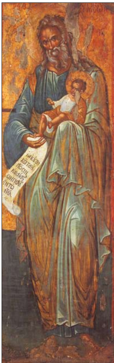
Εικόνα 4. Ο Άγιος Συμεών ο Θεοδόχος.

δεν κόβουνε με το μαχαίρι τίποτε, ούτε ψαλίδι ανοίγουν, ούτε ξύλα κόβουν με το τσεκούρι, «για να μην πάθει το παιδί καμίας εγκύου τίποτε». Την παραμονή πριν κοιμηθούν οι έγκυες βγάζουν τα ρούχα τους ανάποδα και προς τα πίσω, ώστε αν κατά τύχη είχαν αγγίξει κάτι, το σημάδι να βγει πίσω για να μη φαίνεται. Ο Άγιος Συμεών κατά τη λαϊκή λατρεία θεωρούνταν προστάτης αλλά και Θεότρομος Άγιος για τις έγκυες τους τρεις πρώτους μήνες της εγκυμοσύνης, γιατί πίστευαν ότι τιμωρούσε αυστηρότατα κάθε παραβάτιδα έγκυο που δεν τιμούσε την εορτή του, απέχοντας από κάθε εργασία, όπως απαιτούσε το έθιμο. Η τιμωρία του Αγίου ήταν ότι αποτύπωνε σε εμφανές μέρος του σώματος του εμβρύου που κυοφορούσε η γυναίκα, κάποιο σημάδι. Έχει όμως και μια βάση ιατρική και δεν είναι απλώς μια ιδεοληψία ή δεισιδαιμονία. Σήμερα γνωρίζουμε ότι η οργανογένεση στο έμβρυο λαμβάνει χώρα τις πρώτες 12 εβδομάδες της κυήσεως. Αν τότε επισυμβεί στρες, αγχώδεις καταστάσεις, ισχυρές συγκινήσεις ή έντονες ενόχες στην έγκυο, τότε η υπερέκκριση αδρεναλίνης, η παραγωγή κατεχολαμινών, στιμουλίνης και Β ενδορφίνης ευνοούν τις εμβρυοπάθειες, ιδίως τις δερματικές δυσπλασίες όπως τα αιμαγγειώματα και τους σπίλους.