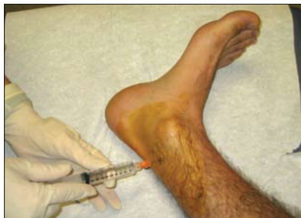
Εικόνα 2. Έγχυση για τον αποκλεισμό του οπίσθιου κνημιαίου νεύρου.

Σε κάθε θέση έγχυσης προηγείται δημιουργία δερματικού πομφού με το αναισθητικό υγρό για τον χειρισμό κυρίως του άγχους του ασθενούς από τον φόβο πρόκλησης πόνου, καθότι ο άκρος πους είναι μια ευαίσθητη περιοχή. Εκ των προτέρων σημαδεύουμε το σημείο έγχυσης με χειρουργικό μαρκαδόρο.