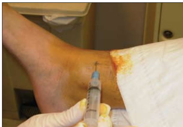
Εικόνα 4. Έγχυση για τον αποκλεισμό του σαφηνούς νεύρου.

Το επιπολής περονιαίο νεύρο, ένας κλάδος του κοινού περονιαίου, κατεβαίνει κατά μήκος της προσθιοπλάγιας επιφάνειας του σφυρού και γίνεται υποδόριο καθώς πλησιάζει τον αστράγαλο. Καθώς εισέρχεται στο πόδι, χωρίζεται σε ενδιάμεσο και μέσο ραχιαίο δερματικό νεύρο, το οποίο περνά πάνω από την επιφανειακή πλευρά του εκτατικού καθεκτικού σύνδεσμου.