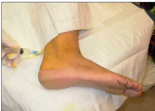
Εικόνα 3. Έγχυση για τον αποκλεισμό του γαστροκνημίου νεύρου.

δίπλα στο έξω όριο του αχιλλείου τένοντα στο επίπεδο 1-2 εκατοστά κάτω από το εξωτερικό έπαρμα του έξω σφυρού. Η βελόνη εισέρχεται υποδόρια προς την κάτω επιφάνεια του έξω σφυρού και προωθείται σχεδόν 1 εκατοστό πριν ενέσουμε 3-4ml αναισθητικού ή και 5ml σε μεγαλιόσωμους ασθενείς (εικόνα 3).