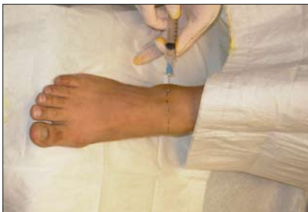
Εικόνα 5. Έγχυση για τον αποκλεισμό του νεύρου.