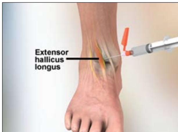
Εικόνα 6. Έγχυση για τον αποκλεισμό του εν τω βάθει περωναίου νεύρου.

από τον αστράγαλο είναι δυνατικά πιθανή η συμπίεση αγγείων ιδίως με τη χρήση αδρεναλίνης.