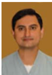
Εικόνα 3. Ο καθηγητής Alam Murad.