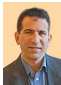
Εικόνα 4. Ο καθηγητής Hayes Gladstone, ιδρυτής της Blade and Light Society.