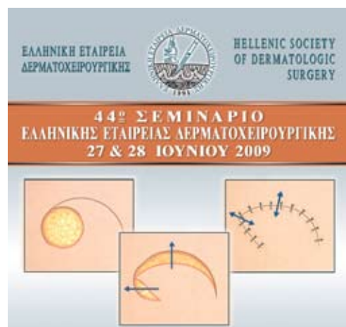
Εικόνα 1. Το εξώφυλλο του προγράμματος.

Ήταν πλαισιωμένοι από τους Δερματολόγους - Δερματοχειρουργούς Suneel Chilikuri, Alysa Herman, Jessica Krant και Rebecca Tung και συνοδεύονταν από νοσηλεύτριες, ιστοτεχνικούς και φωτογράφο. Η ομάδα αυτή εκπροσωπούσε την εθελοντική εταιρία "Blade and Light Society" ή οποία ήταν και χορηγός του ταξιδιού. Πρόκειται για μη κερδοσκοπική εταιρία την οποία ίδρυσε ο Hayes Gladstone και ο Murad Alam, το 2003 με σκοπό την προώθηση ανθρωπιστικών αποστολών, την έρευνα και τη συνεργασία μεταξύ των δερματοχειρουργών.