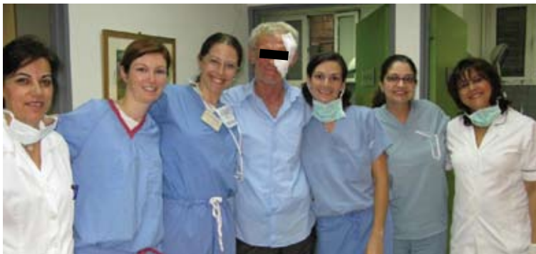
Εικόνα 6. Η ομάδα του χειρουργείου με ασθενή μετά την ολοκλήρωση αφαίρεσης και αποκατάστασης δύο βασικοκυτταρικών καρκινωμάτων.

Ο Gladstone και η ομάδα του εκτέλεσαν χειρουργικές αφαιρέσεις όγκων με τη μέθοδο Mohs κι ακολούθως πλαστικές αποκατάστασης στα χειρουργεία του νοσοκομείου «Ευαγγελισμός», ενώ οι 50 δερματολόγοι που συμμετείχαν στο σεμινάριο παρακολουθούσαν τις επεμβάσεις με κλειστό κύκλωμα προβολής στο αμφιθέατρο του νοσοκομείου. Το σεμινάριο περιλάμβανε και θεωρητικό μέρος.