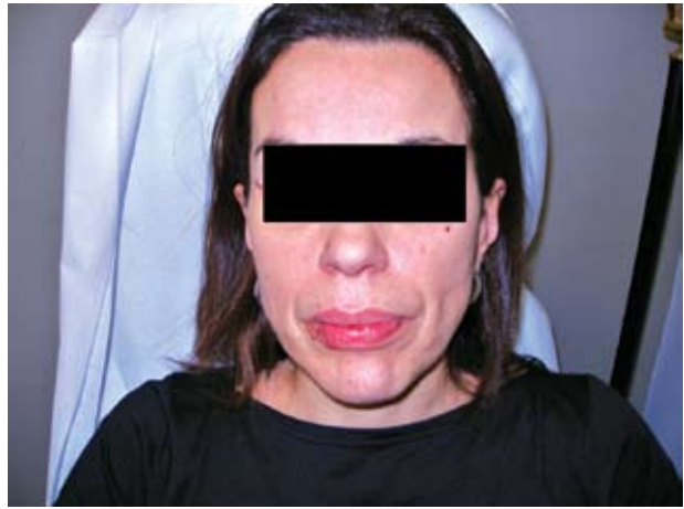
Εικόνα 1β. Μετά την επέμβαση.