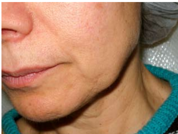
Εικόνα 3α. Πριν την επέμβαση.