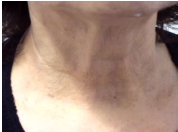
Εικόνα 5β. Μετά την επέμβαση.

cogs that constitute a supporting structure for the face and prevent the shifting of the thread. They were initially called aptos (greek word “anti ptosis”). The procedure is relatively easy with no significant side effects.