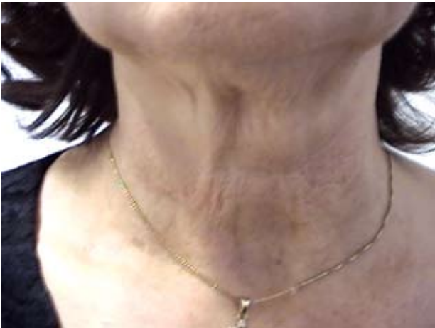
Εικόνα 5α. Πριν την επέμβαση.