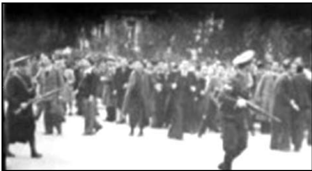
Εικόνα 5. Το συλλαλητήριο του 1943

γήθηκε στην Ιατρική Σχολή την εκλογή του στη θέση του Υφηγητού της Γυναικολογίας, όπως την είχε προετοιμάσει ο Λογοθετόπουλος.