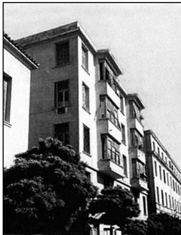
Εικόνα 2. Η πολυκατοικία Λογοθετόπουλου