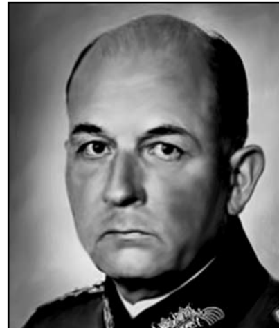
Εικόνα 3: Στρατάρχης von List

της Πρυτανείας του εγκαινιάστηκαν τα Εργαστήρια της Ιατρικής Σχολής στο Γουδί καθώς και οι Πανεπιστημιακές Κλινικές στα Νοσοκομεία «Λαϊκό», «Ιπποκράτειο» «Ευαγγελισμός» και «Κρατικό». Εξάλλου θεμελιώθηκε το Δημόσιο Μαιευτήριο Αθηνών, δηλαδή το Μαιευτήριο «Αλεξάνδρα» καθώς και το Οδοντιατρικό Σχολείο.